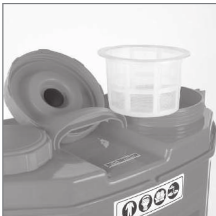
Фильтр (фильтрует осадок в пестицидах)