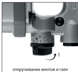
откручивание винтов и гаек

Проверьте установленное направление вращения. Для откручивания винтов и гаек установите переключатель направления вращения в направлении (1). Для закручивания винтов и гаек установите переключатель направления вращения в направлении (2).