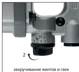
закручивание винтов и гаек

Проверьте положение переключателя крутящего момента: при откручивании используйте максимальный момент, при закручивании – момент, соответствующий типоразмеру и прочности резьбового соединения. Для включения инструмента нажмите выключатель и удерживайте его нажатым во время выполнения рабочей операции. Для выключения отпустите выключатель.