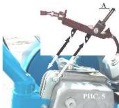
Кронштейн переключения скоростей

5.1.7 Установить кронштейн переключения скоростей с двумя тросами на коробку мотоблока Рис. 5