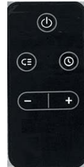
Пульт дистанционного управления